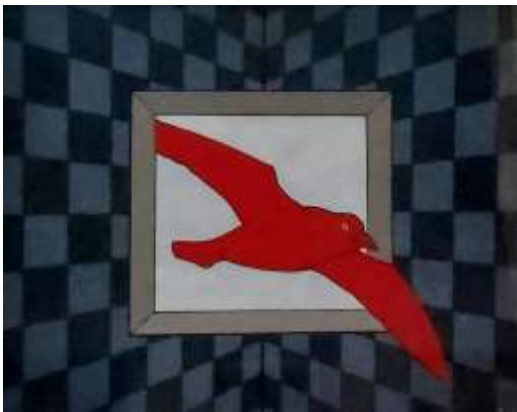
Francesco Casorati (Torino 1934 – To 2013) Arrivo, 1981 Olio su cartone, cm 35 x 50