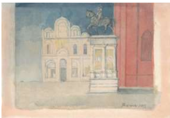
Ivan Theimer, Venezia, 2003 Acquarelli su carta cm 18x25