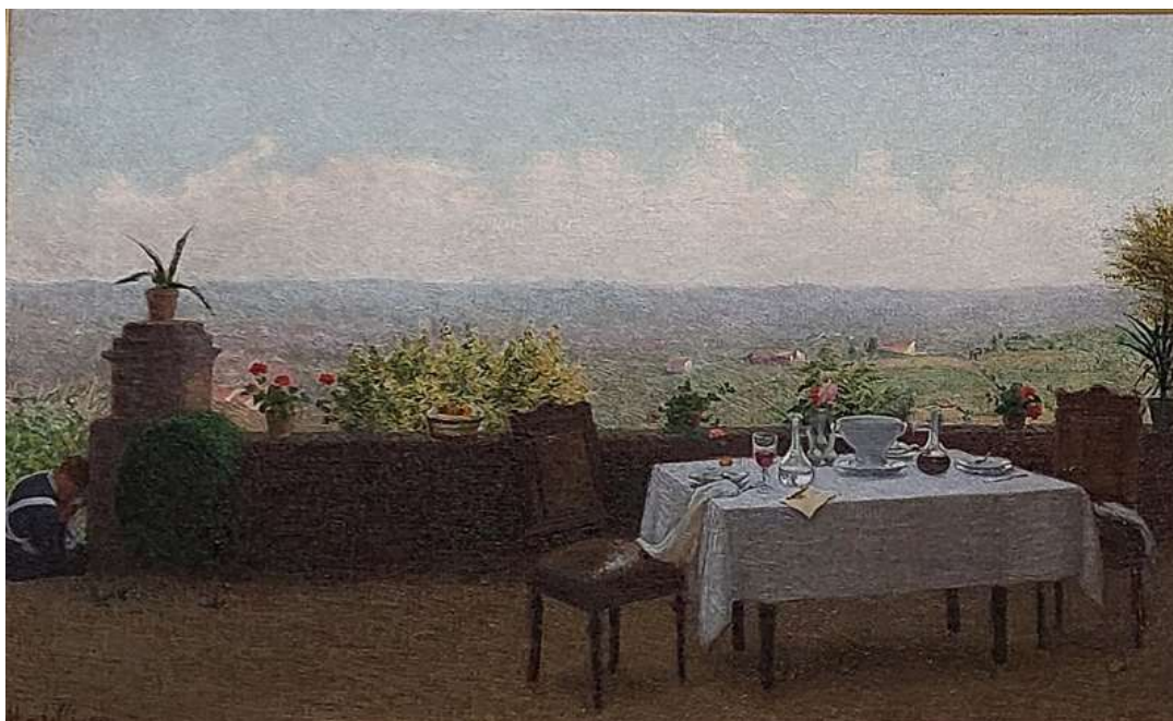
Angelo Morbelli , (Alessandria 18 luglio 1853 – Milano 1919)

Il telegramma, 1915, olio su tela, cm 42,5 x 68,5