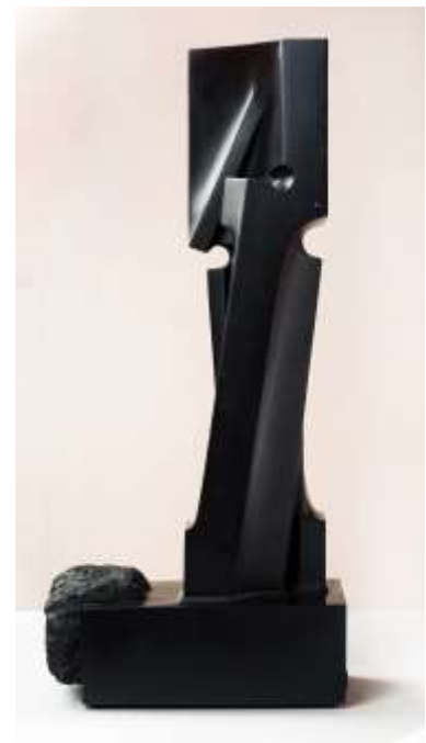
Gio' Pomodoro (1930 – 2002) Marat, Scultura in marmo, h cm 54 Autentica Archivio Gio' Pomodoro Milano