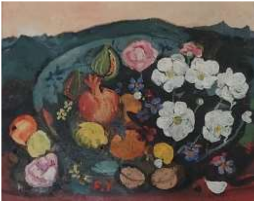
Francesco Tabusso , (1930 - Torino 2012) Fiori nel cappello, 1988 Olio su tela, cm 40 x 50