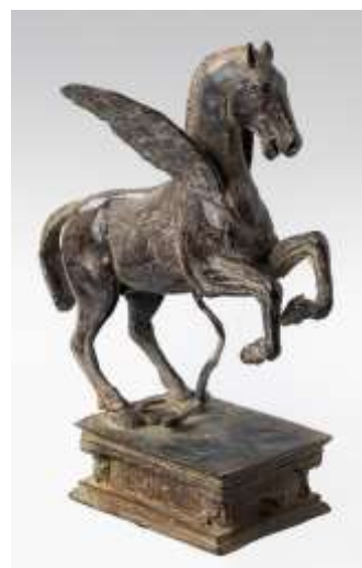
Ivan Theimer, Pegaso, 2001 Bronzo, 23 x 9,8 x 7,6 cm