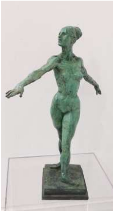
Francesco Messina (1900-1995) Danzatrice, Bronzo verde, h 50 cm