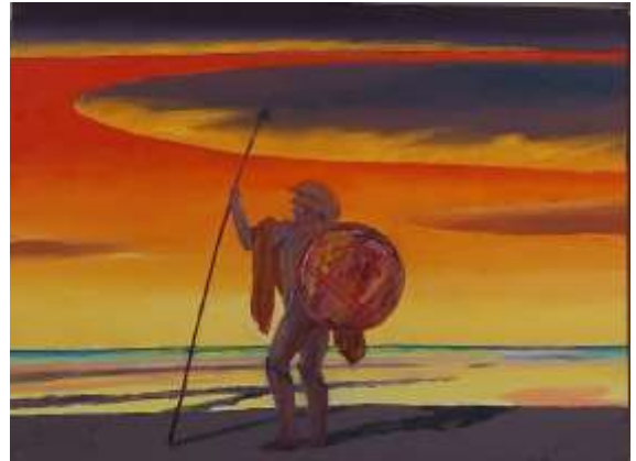
Giorgio Ramella (Torino, 1939) Verso la sera, 2018 Olio su tela, cm 30 x 40