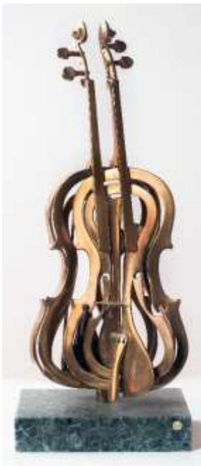
Arman (Nizza, 1928 - New York, 2005) Violino scomposto, 29/100 Scultura in bronzo, h 63