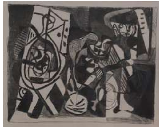
Pablo Picasso ( Malaga 1881 - Mougins 1973) Scène d'intérieur, 1926 Litografia, cm 22,3 x 28 Tiratura 100 esemplari Editore Simon, stampatore C. Freres. Pubblicato Bloche n 74, Mourlot XXI