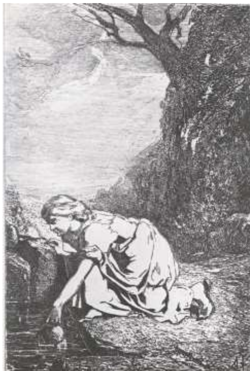
Antonio Fontanesi (Reggio Emilia, 1818 - To, 1882) Donna alla Fonte, Carboncino su carta, cm 65 x 35