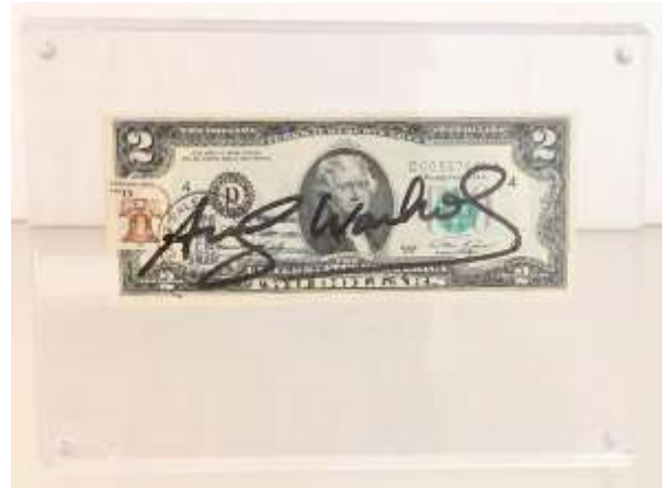
Andy Warhol (Pittsburgh 1928 - New York 1987) 2 Dollars (Thomas Jefferson), 1976 Carta moneta, cm 15 x 6,5