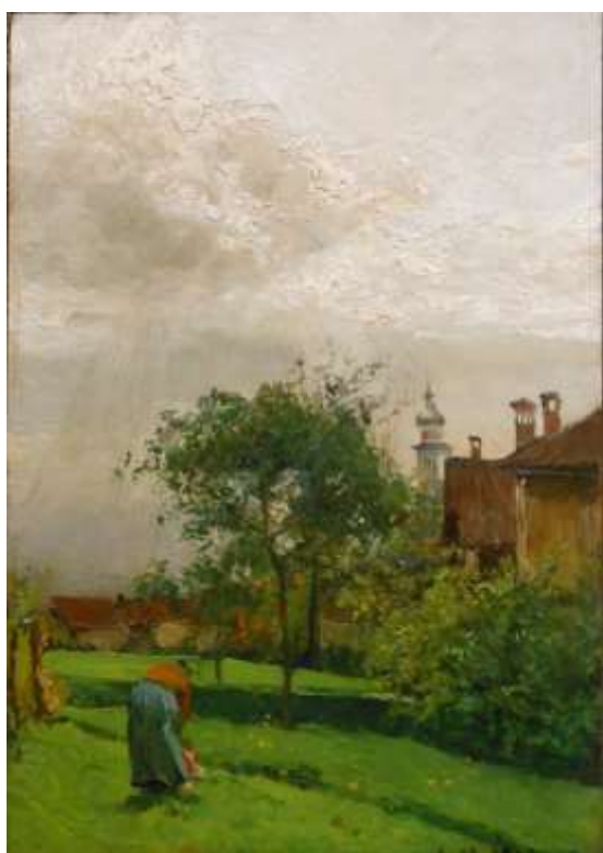
Lorenzo Delleani (Pollone, 1840 – Torino, 1908) Ottobre in Piemonte, 4.10.1903 Olio su tavoletta, cm 45 x 31 Datato in basso a sinistra