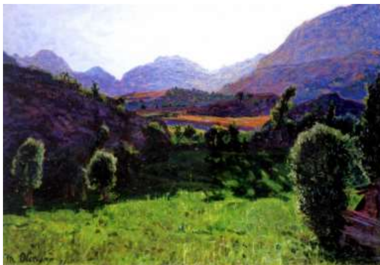
Matteo Olivero , ( Acceglio 15 giugno 1879 - Saluzzo 28 aprile 1932) Nei pressi di Acceglio, 1919 Olio su tavoletta, cm 55,5 x 38