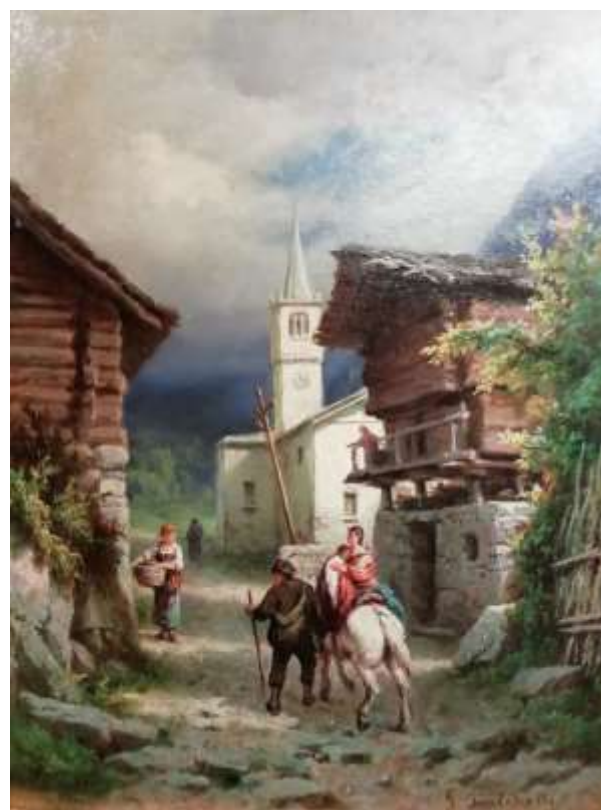
Giuseppe Falchetti (Caluso, 1843 – Torino, 1918) Borgata di montagna Olio su cartone, cm 44 x 33