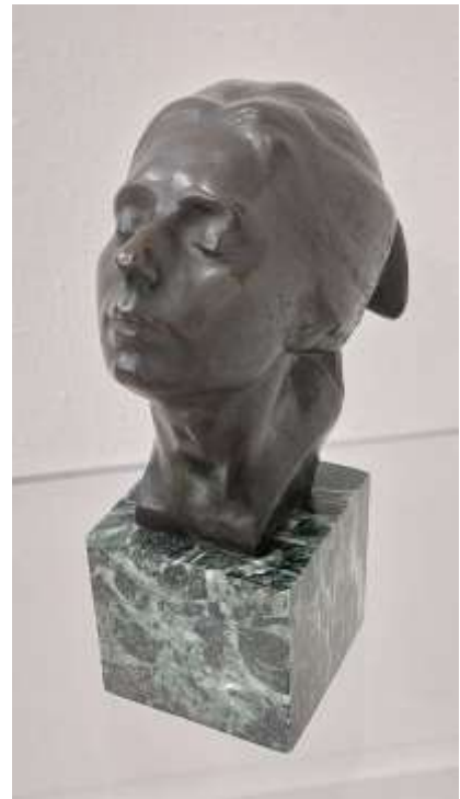
Davide Calandra (1856 – 1915) Viso di donna, Scultura bronzo, h 23