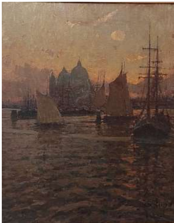
Alessandro Lupo (Torino, 1876 – Torino, 1953) Venezia, Olio su tela, cm 85 x 70