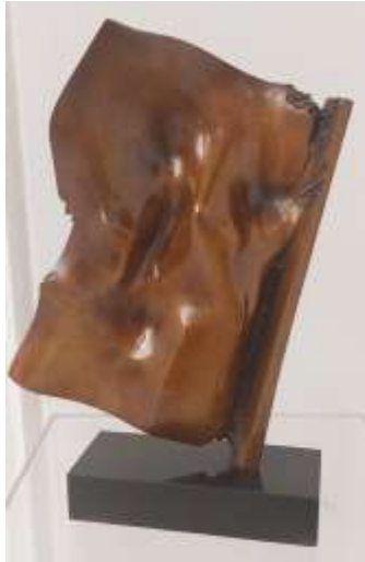
Gio' Pomodoro (Orciano Pesaro 1930 - Milano 2002) Vela fin mare Scultura in bronzo, h 38 cm Autentica Archivio Gio' Pomodoro Milano