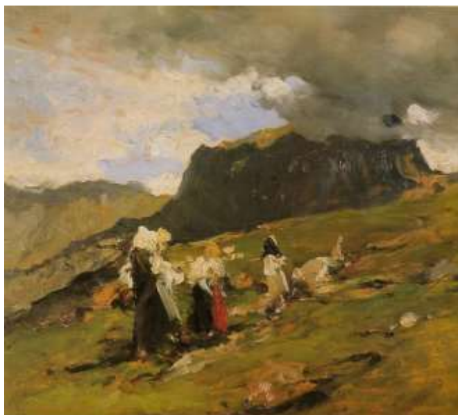
Lorenzo Delleani (Pollone, 1840 – Torino, 1908) Bozzetto per San Martino, Olio su tavoletta, cm 31 x 35