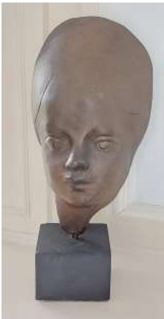
Umberto Mastroianni (1910 – 1998) Volto femminile, Bronzo, h 35,5 cm