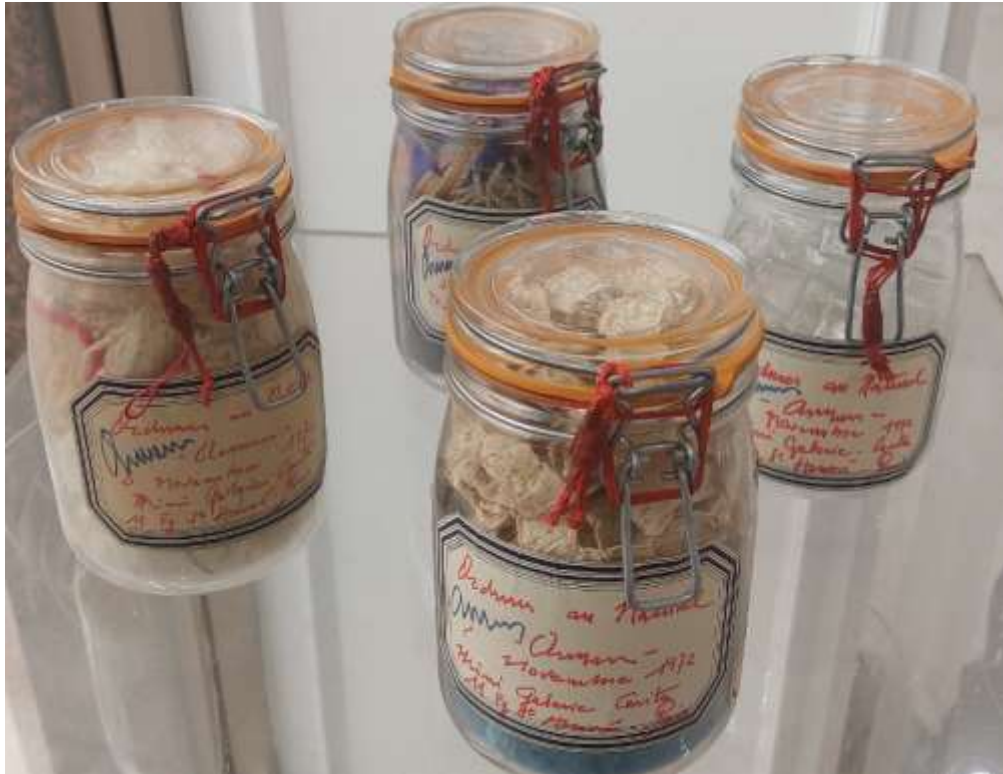
Arman - "Ordures au Naturel", 2 novembre 1972, Mini-Galerie Carita, 11 Fg. St. Honoré - Paris h 18 cm - larghezza 12 cm

“Grazie ai materiali plastici, il barattolo in decomposizione, senza marcire, continua per sempre nello stato di marcire. Il culmine è che questi scarti del ciclo di produzione-consumo-distruzione acquisiscono la maestosità di un'icona nella loro preziosa teca. In una sola giornata, Arman mise nei barattoli i rifiuti personali portatigli dai visitatori della galleria, in totale vennero realizzati 150 vasetti, firmati dall'artista”.