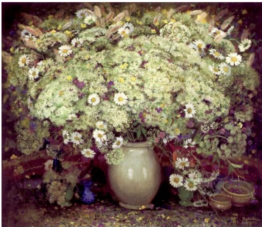
SOBRILE Giuseppe Vaso di Fiori, 1925 Olio su tela, 90 x 106 cm